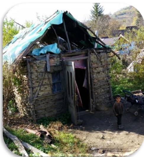
Het oude huis van moeder C.