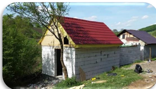
Het nieuwe huis van C.